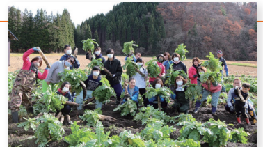
収穫を喜ぶ参加者たち。

【申込・問合せ】西宮 ☎080-3195-9241 E-mail: akita.iburibigin@gmail.com