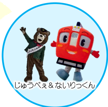
じゅうべえ & ないりつくん