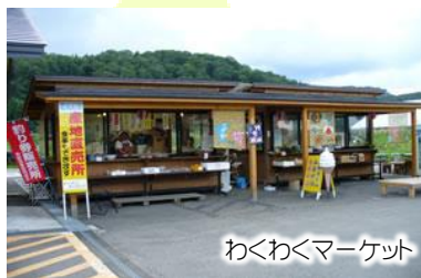
わくわくマーケット

紙風船館の隣にあり、地元のお母さんが心を込めて作った手作りのお菓子や季節の山菜などを販売しています。麺類、丼物、出来たて弁当、おにぎりも取り揃えております。