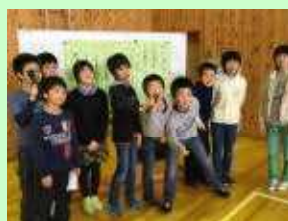
来年は任せてください