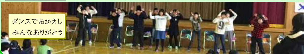
ダンスでおかえし みんなありがとう