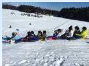
4年生の女の子は園児たちとそりをつなげて滑り。大はしゃぎ。男の子たちは田んぼの上でサッカーを楽しみました。