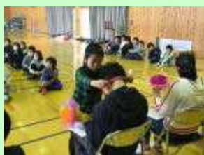
一生懸命つくりました