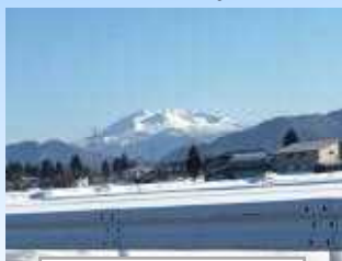
駒ヶ岳がくっきりと

2月最後の火曜日28日はよく晴れました。駒ヶ岳もきれいに望め、雪もしまって朝のうちは絶好の雪渡り日和でした。ほとんどの学年が外に出て「かた雪」の上で思う存分楽しみました。