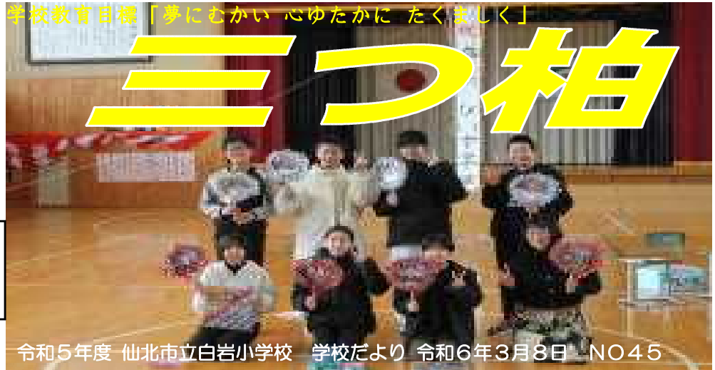
令和5年度 仙北市立白岩小学校 学校だより 令和6年3月8日 NO45