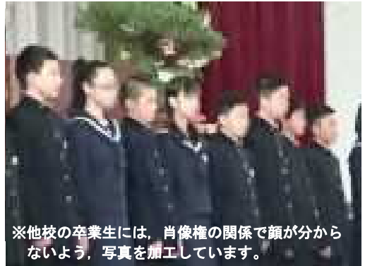
※他校の卒業生には、肖像権の関係で顔が分からないよう、写真を加工しています。

卒業した19名は中学校で学習、部活動、生徒会活動で頑張ってくれるだろうと思います。私たちも負けずに頑張っていきましょう。