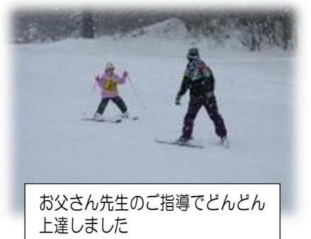
お父さん先生のご指導でどんどん上達しました