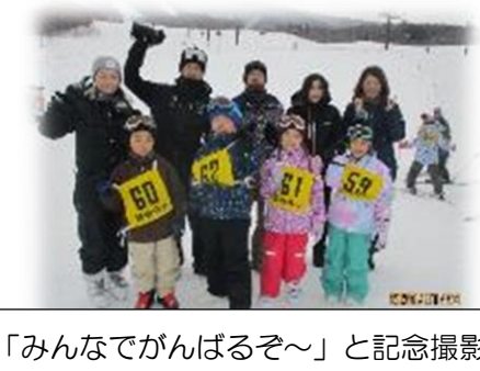
「みんなでがんばるぞ～」と記念撮影