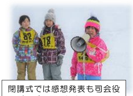
閉講式では感想発表も司会役もがんばった3年生