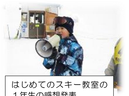
はじめてのスキー教室の1年生の感想発表