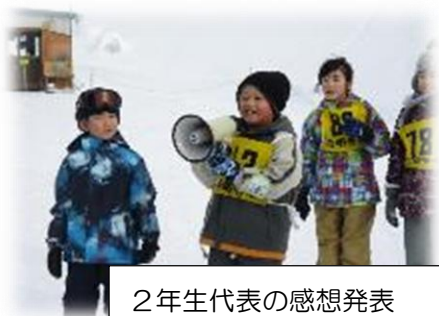
2年生代表の感想発表