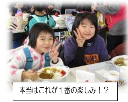
本当はこれが1番の楽しみ!?