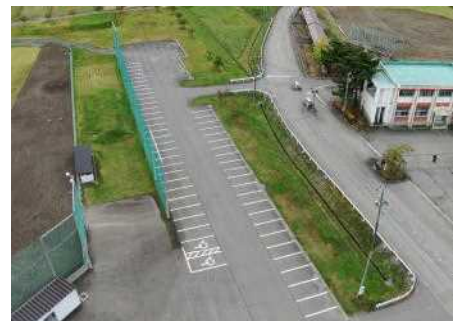
ドローンで撮影（世の中便利になりました）