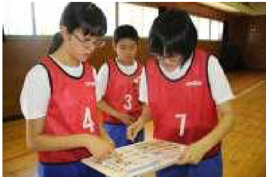
ハードルの跳び方を確認し合う1年生

新型コロナウイルスに伴う休校のあと1ヶ月以上が経ちましたが、本校では授業や生徒活動のほか部活動も軌道に乗り、生徒たちも毎日元気に生活しております。そんな中、今月は学校外からお客様をお迎えする機会が3回ありました。2日(火)は教育委員会から総合学習アドバイザーの先生方が、10日(水)は1年生の体育の研究授業で、16日(水)は3年生の数学の研究授業で、毎週来客がありましたが、どの先生方からも落ち着いて授業に向かう態度や真剣に課題に取り組む姿勢を褒めていただきました。今後も職員一同で、生徒たちの目が輝く授業づくりに取り組んでいきたいと思っております。