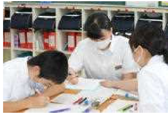
グループで数学の課題に取り組む3年生