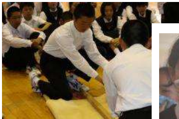
応急担架づくり(上)

29日(火)に、地震と火災を想定して避難訓練を実施しました。昨年度は避難訓練の後に消火体験を行いました。今年度は西木消防分署の方々の指導のもと、煙道体験と応急担架づくりに挑戦しました。生徒たちにとっては、貴重な体験になりました。