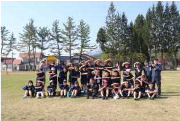
校長先生を中央に記録会…記念の一枚

部活動も本格的に始まり、運動部での練習試合等での活躍も聞こえてきます。今後も、学習を始め学校生活全般に前向きに取り組んでいけるよう、支援していきたいと思っております。