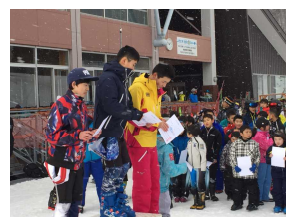
表彰台上立つ賢生さんと康平さん