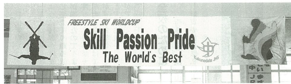
ワールドカップ秋田たざわ湖大会横断幕