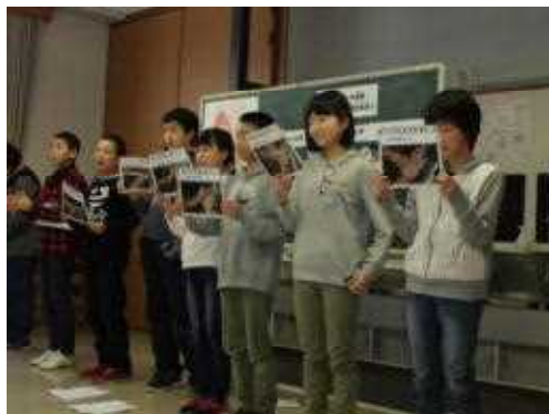
キラキラ星の歌で手洗いのポイントを

19日(火)は、保健給食委員会が集会を開いてくれました。風邪がはやっていることを受けて、「風邪に負けない体をつくるための食べ物」「効果的なうがいの方法」「手洗いの大切さとその方法」について、クイズや実演、替え歌などを使って、楽しく分かりやすく教えてくれました。また、ゲストティーチャーとして栄養教諭のS.先生からも、タンパク質やビタミンをとることや、好き嫌いせず食べることについてアドバイスいただきました。