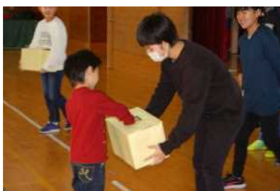
どんなしおりが当たるかな？

11月28日(火)に、図書委員会が『図書集会』を開いてくれました。「読み聞かせ」「オススメの本の紹介」「ウォークラリー」「しおりのプレゼント」と盛りだくさんの内容でした。