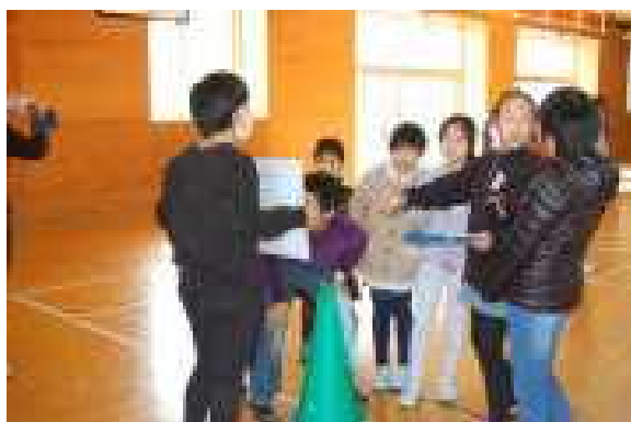
「ひつじの名前は何だったけ？」