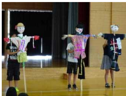
かかしのファッションショー