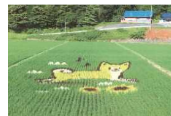
上桧木内駅近くの田んぼアート