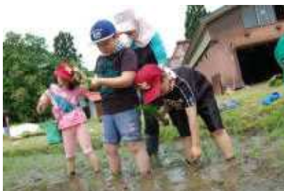
1年生は初めての田植えです