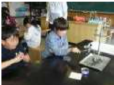
科学実験クラブは花火を作りました