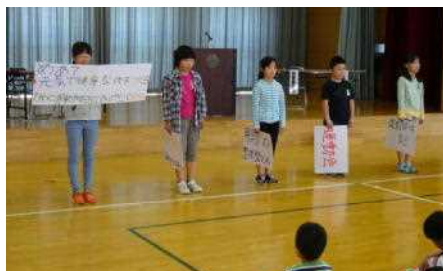
運動環境委員会の紹介です