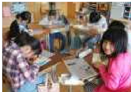
クッキング&手芸クラブは黙々と製作