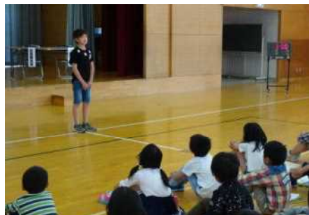
代表委員会委員長のあいさつ

この3つは大人になってからも大切な力です。早いうち習慣にしてしまうと、自然に返事やあいさつの声が出てきます。「従業員があいさつをしない会社はすぐにつぶれてしまうが、従業員同士が気持ちのよい返事をしたり、あいさつをしたりしている会社は売上げが伸びる。」という話を子どもたちにして、返事やあいさつのパワーを考えてもらいました。