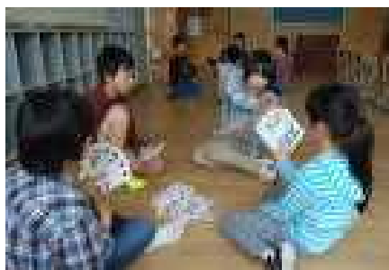
室内ゲームクラブの様子です

4年生以上の児童が「あったらいいな」と思うクラブを考え、その中から今年は、《室内ゲーム》《スポーツ》《科学実験》《クッキング&手芸》の4つのクラブが誕生しました。先生たちと相談しながら、活動計画を立て、様々な活動に挑戦します。ここでも6年生がリーダーシップを発揮しています。