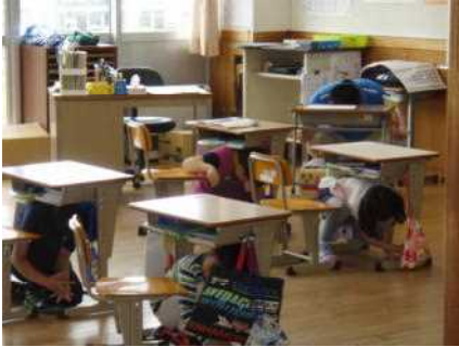
1年生も真剣に行いました

私は、2011年の東日本大震災の時も、桜木内小学校におりました。強い揺れで、防火扉がしまったり、スクールバスの車庫のシャッターが停電のため開かなかったり、その後も停電が続き連絡がとれなかったり、と思いがけないことが起こり戸惑いました。それでも、子どもたちが怖がりながらもきちんと言うことを聞いてくれたので、だれもケガ一つせずに無事でした。しかし、後で思い返すと反省点もたくさんあります。その時の教訓を忘れず、安全対策を心がけ、子どもたちを守っていきたいと思います。