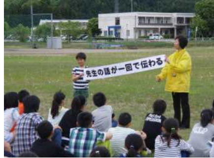
1回で指示が通るように普段からしっかり聞くことを心がけましょう