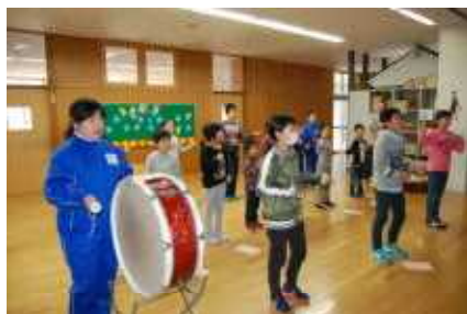
紅組の応援練習の様子です

1年生にとっては、初めての運動会。2年生の手の振り方などを見本にしなが、走る姿も様になってきました。今のところ、運動会当日は晴天のようです。どうぞ、ご家族揃っておいでください！！