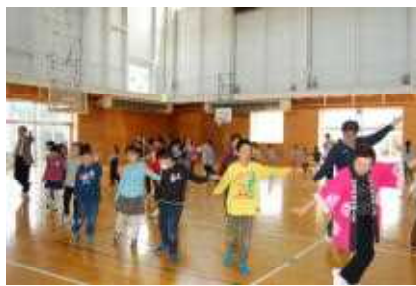
輪になって北浦音頭を練習しました