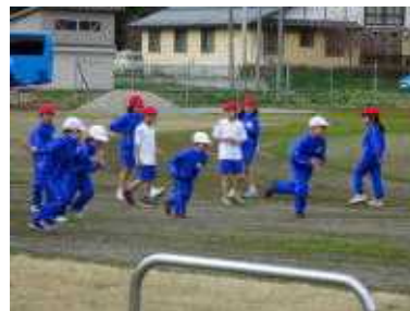
1年生のスタートダッシュです