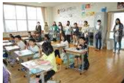
2・3年生の国語の授業です

何といても、多数の参加を得て、大変心強く思いました。次回以降のPTAも、そしてこれから始まるたくさんの学校行事やPTA行事でも、保護者の皆様のパワーをお貸しいただければと思います。おじいちゃん、おばあちゃんの参加もお待ちしています。