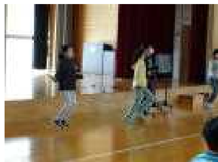
『めきめきタイム』縄とびの様子です。運動環境委員がリードしています。

岡山から神代に家族で引っ越してきました。 今まで中学校で数学を教えていましたが、小学校は初めてです。元気いっぱい楽しく過ごしたいと思います。よろしくお願いたします。