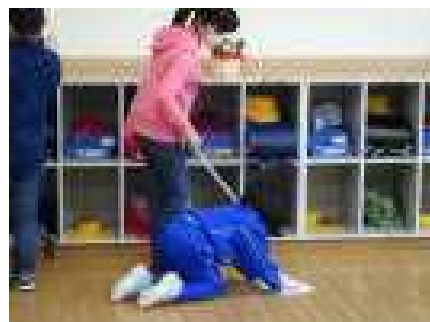
少ないメンバーで大変ですが、一生懸命掃除しています。