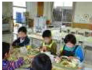
1年生の給食の様子です

19日は、身体計測がありました。「去年より大きくなったよ」「視力はAだったよ」と教えてくれました。自分の順番がくるまで、おしゃべりもせずに、静かに待っている様子も立派でした。