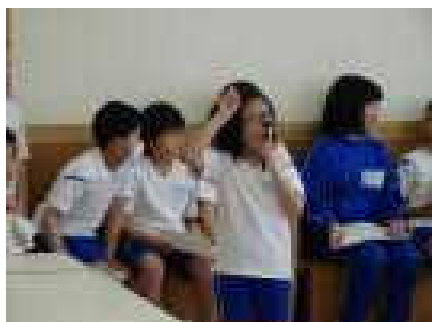
みんな静かに待っていたので、スムーズにできました。