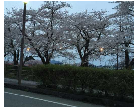
楡木内川沿い(角館)の桜 <帰宅途中に撮影>

さて、新年度が始まりすでに3週間が過ぎました。1年生は学校生活にも慣れ、入学した当初の緊張感あふれる表情とは違って、元気いっぱい活動している様子が見られます。上級生となった2～6年生も、いろいろな場面で活躍しており、今年度も順調なスタートを切ることができました。これからの子どもたちの活躍と成長が楽しみです。