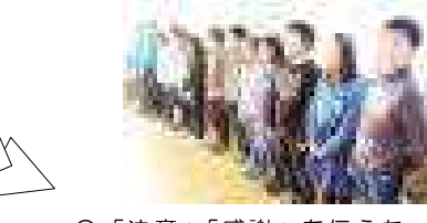
○「決意」「感謝」を伝えた 2分の1成人式 (4年総合)