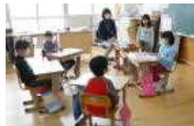
○こんなに上手に話し合いができるよ (1年学活)

たくさんの保護者の方々のご参加を頂き、第4回の公開ができました。授業参観では、それぞれの学年が趣向を凝らした演出をしていたようです。その後の全体会では「校長あいさつ」につづき、教頭より「学校評価」について説明をさせていただきました。また、同時にお招きしました学校評議員の皆様からお褒めの言葉とともに、多くのアドバイスをいただきました。皆様からいただいたご意見を参考にさせていただき、学校として改善すべきは早急に手を入れていきたいと考えております。今後も手を携えて子どもたちを支えて参りたいと思いますので、よろしくお願い申し上げます。