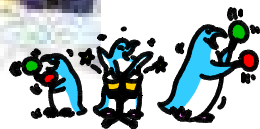
○「複合型国語?」 難しいなあ (5年)