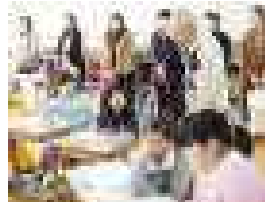
○普通の三角形さがし? (3年算数)