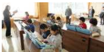
○合奏って楽しい (2年音楽)