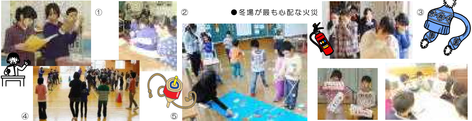
●冬場が最も心配な火災