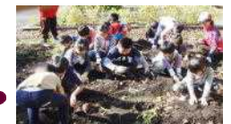
●もくもくといもほり