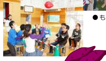
●もうすっかり仲よしだね