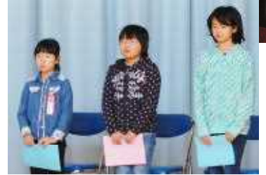
●後学期もがんばるぞ!! 抱負を述べる学年代表