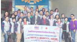
●「ども美」も国際化してきたよう・・・ 大人気のひのきっ子たち