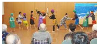
●1・2年生の劇で、ますますお元気に!!