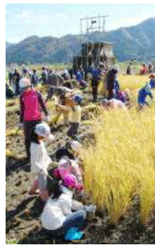
●地域の皆様の手をお借りし、今年も貴重な体験ができました。