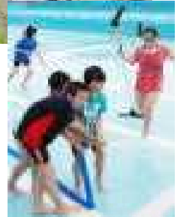
○イタズラ好きボーイズ

ちょっぴり肌寒い日でしたが、全校が協力してプール清掃を行いました。長時間の清掃作業に、全員が集中して取り組めることは立派なことです。これでみんなが大好きなプールもスタンバイOK、これからの活用が楽しみです。 ヘッドスライディングは高学年の特権となっているようで、うらやましそうな後輩を尻目に何度もスライディングを繰り返す兄貴・姉貴たちでした。 安全に楽しく、そして泳ぎが上達するように期待しています。