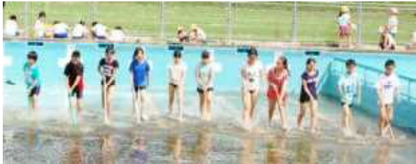
○恒例のモップ・ワイパーリレー スタート