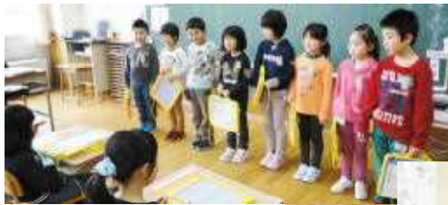
○案内役は私たちにおまかせ!!