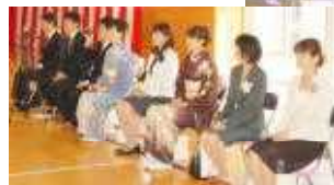
○お家の方々もやや緊張気味?