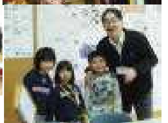
○校長室(館長室)は不思議なものがいっぱい