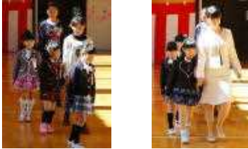
○先生に手を引かれ入場です

快晴に恵まれた4月9日(水)、待ちにまった入学式が行われ、5名(男1名女4名)のかわいい新入生がひのきっ子の仲間入りをしました。はじめは少々緊張気味の新生も、大きな声で、「はい!!」と立派な返事ができました。小学生になった喜びを全身で表していた子どもたち。お兄さんやお姉さんたちとの楽しい学校生活の始まりです。