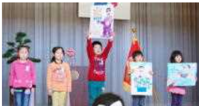
○歓迎のパフォーマンスは2年生張り切っています。