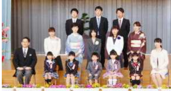
○立派に式を終え、記念にパチリ!!