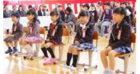
○お話をしっかり聞ける5人です