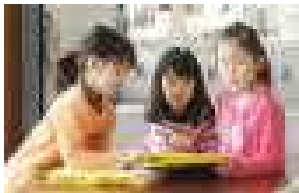
○保健室はあまり来ない方がいいわあ