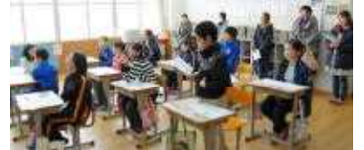
○「誠実」って何だね？(5年)