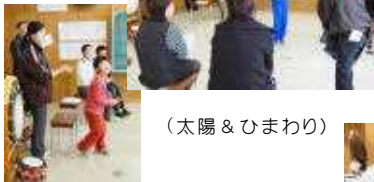
(太陽 & ひまわり)