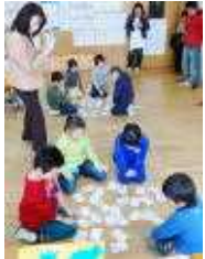
○冬のことはを あつめたよ(1年)

また、PTA公開日との抱き合わせ「親子餅つき」はいかがでしたでしょうか？運営部の方々が準備周到に計画してくださったおかげで、きわめてスムーズに楽しい思い出ができました。本当にありがとうございました。さらに、「学校評価アンケート」に関しましては、P(親)とT(教師)が連携し、子どもをよりよく育てたいという目的や願いのもとに実施するもので、アンケートの活用こそが問われます。冬休み中に集計し、さっそく学校の営みに反映させていきたいと考えています。今年の登校もラスト3日、風邪などひかずに元気に登校して欲しいものです。