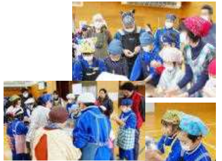
○みんなでこねれば おいしいぞ！！