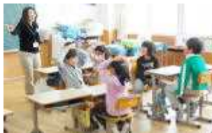
○英語で遊びたい人は 手を頭に！(3年)