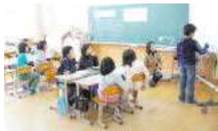
○ぼくとみんなの共通部分は ここなんです(4年)