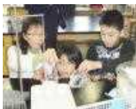
どちらもすばらしい 集中力で課題に向かえる ようになりました。