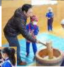
○もっと食でぐねがぁ彩海ちゃん 食でえ おら「合い取り」がんばったおん