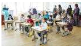
○九九をつくるんだぞ 笑っちゃだめだぞ(2年)