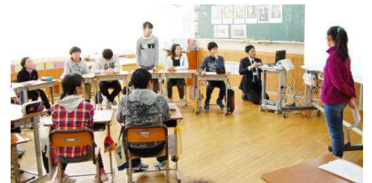
○「お気に入り」でいこう！！(6年)