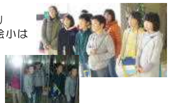
裸のつきあい、山の芋鍋もペロリ 最高にしあわせな学校だよ松小は