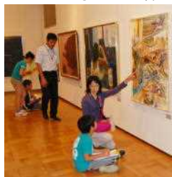
○震災直後に描かれた作品も・・・