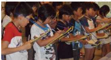
○調べ学習が得意なひのきっ子たち

6月17日、「ひのきないこども美術館」が開館し1周年を迎えました。給食後に、その1歳の誕生日を全校でお祝いしました。その間に来館された方は約500名と、じわじわと反響が広がり、松木内に「こども美術館」ありと周知されつつあることを喜んでいます。その記念にと、お世話になっている平福記念美術館で開催されている「エコール・ド・N～北の画人～展」を見学してきました。北東北隣県との文化交流企画展で、東日本大震災の被災者の方々の作品も展示されています。この展覧会に何とひのきっ子の作品も招待出品されているのです。 専門家のすばらしい作品に引けをとらない力作をご家族・地域の皆様もご覧ください。(この日曜日までの会期ですが・・・)