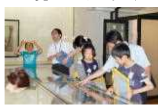
○郷土の偉人 百穂先生 画家・歌人・そして・・・