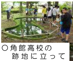
○角館高校の跡地に立っているんだあ 木立の中にひっそりと建つすてきな建物です