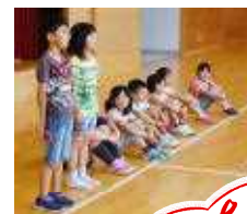
○よく覚えたね 2年「スイミー」