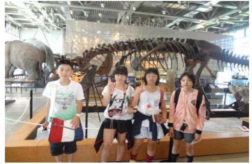
恐竜の骨の前で（科学館③）