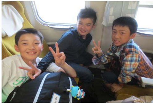
疲れ知らず！（こまち車内）