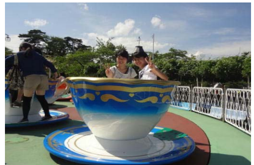
カップにin！（ベニーランド③）