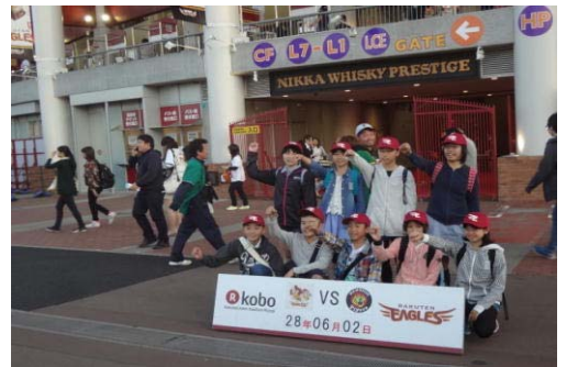
楽天ファイトー！（コボスタ①）