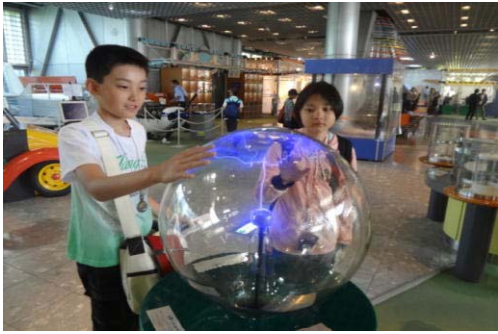
静電が見える！（科学館①）