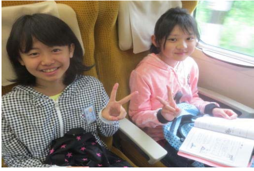
さ～ 出発だ！（こまち車内）