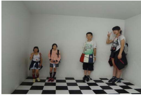
Rさん小さ過ぎ！（科学館②）