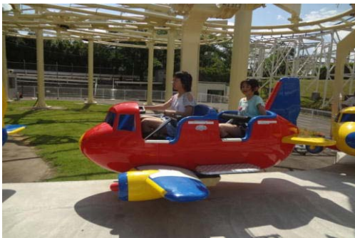
飛行機操縦！（ベニーランド①）