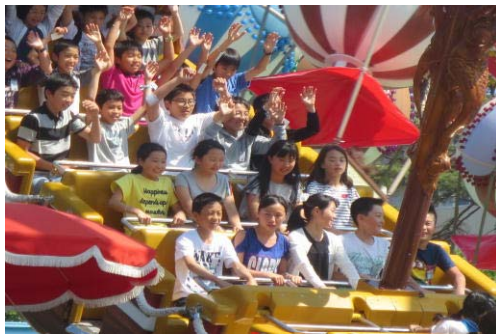
5人揃って！（ベニーランド②）