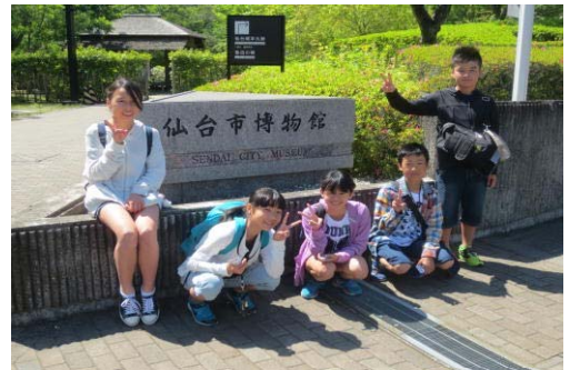
入り口前で（博物館③）