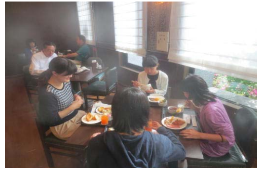
朝から女子会！（朝食③）