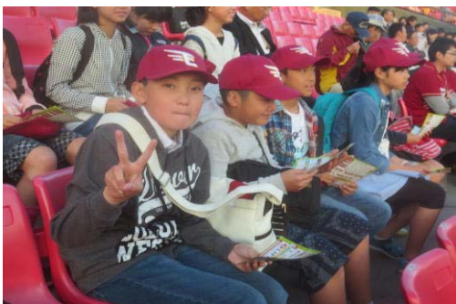
試合の行方は？（コボスタ②）