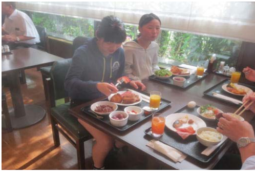
朝からガッツリ！（朝食①）