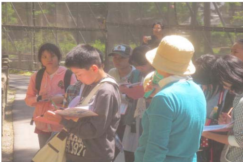
メモをしっかりと（瑞巖寺②）