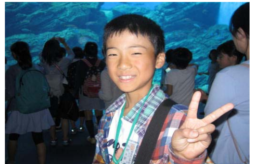
大水槽前でピース（水族館①）