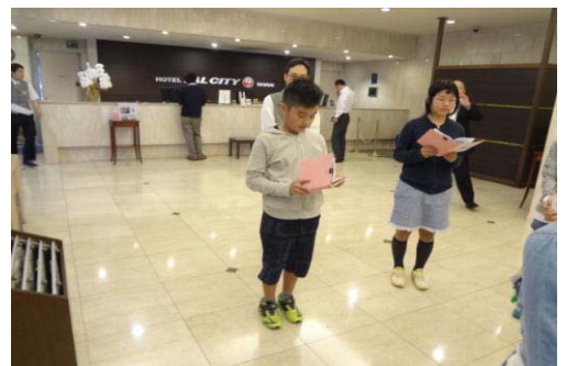
入館の集い（JALホテル）