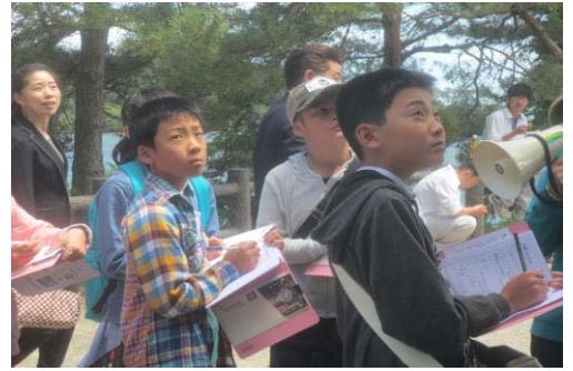
説明よく聞いてます（瑞巖寺①）