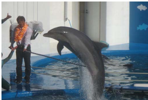
イルカショー（水族館③）