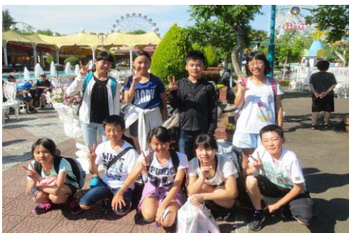
笑顔が最高！（ベニーランド④）