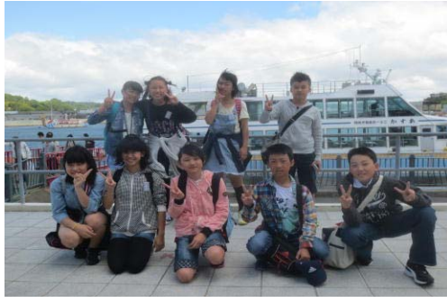
遊覧船前でパチリ（松島）