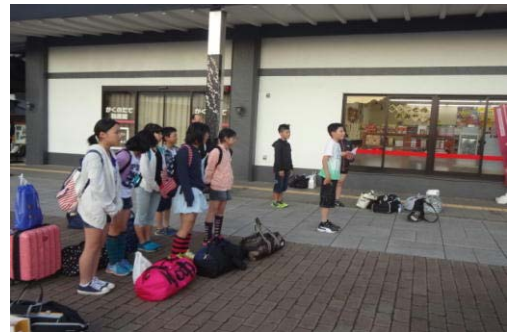
ただいま〜！（角館無事到着）