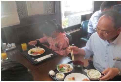
こちらは控えめ？（朝食②）