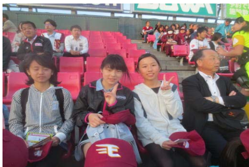
気持ちは阪神？（コボスタ③）