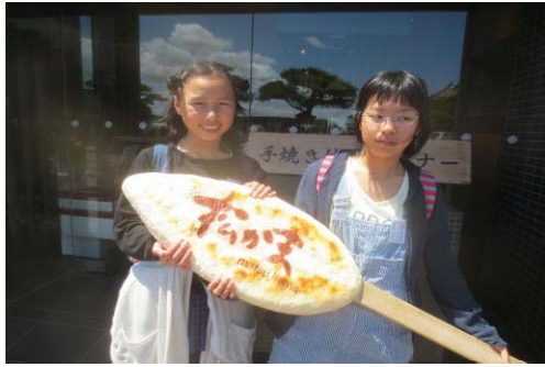
かまぼこデカッ！（松島昼食後）