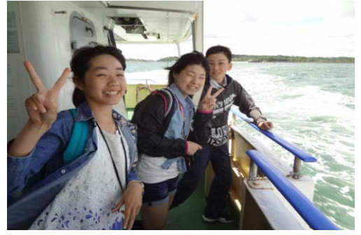
波しぶきと風が・・・（遊覧船内）