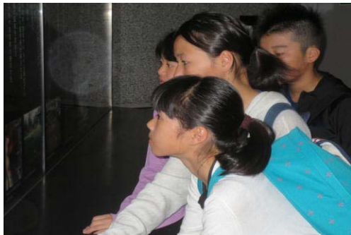
何見ているの？（博物館②）