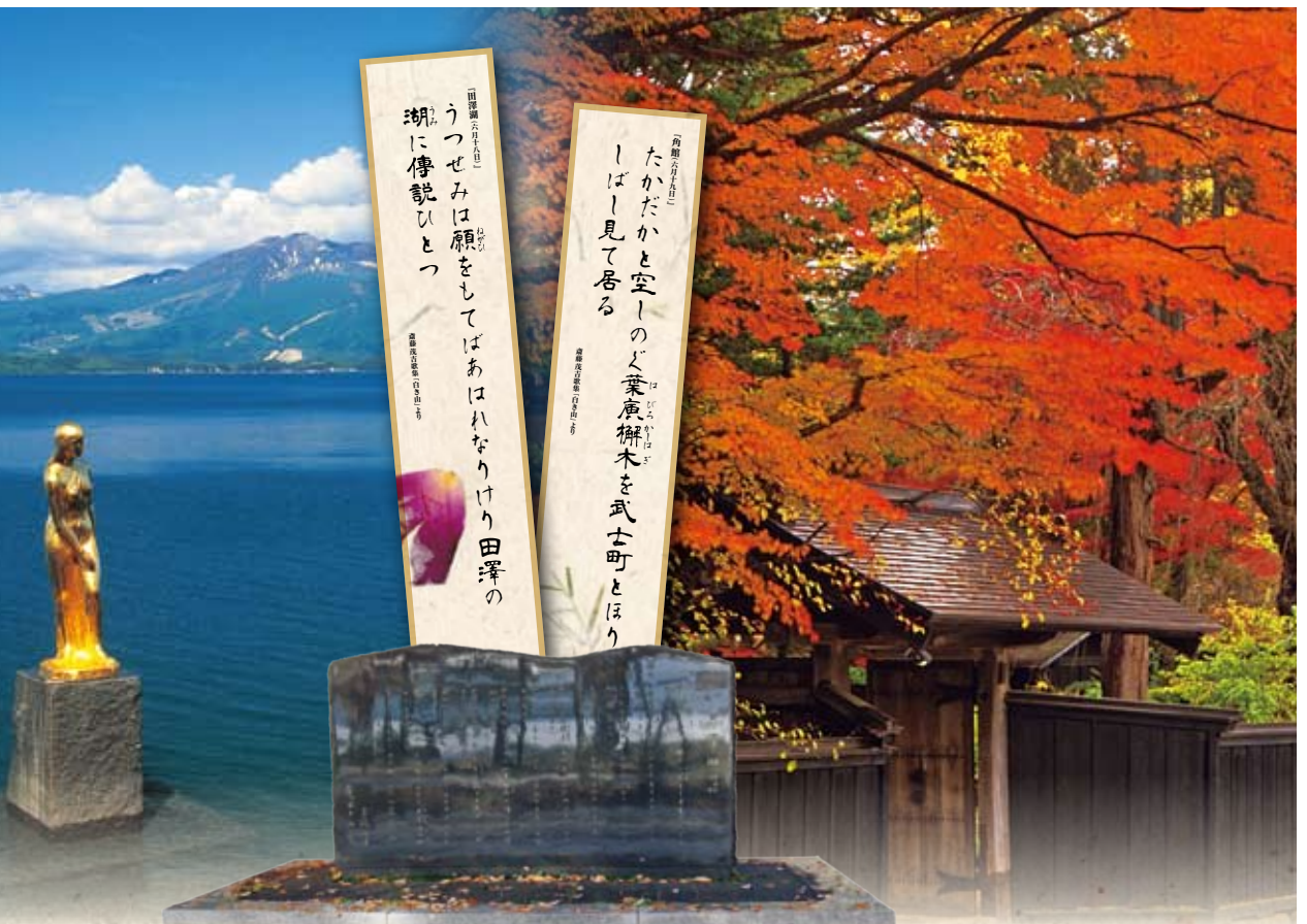
斎藤茂吉歌碑 「田沢湖(六月十八日)」歌集「白山山」より (秋田県仙北市田沢湖 観水広場)