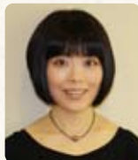
俵 万智氏 (歌人)