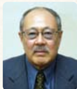
佐佐木 幸綱氏 (歌人・早稲田大学名誉教授)