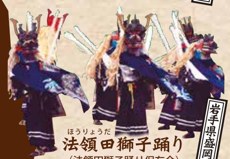
法領田獅子踊り (法領田獅子踊り保存会)