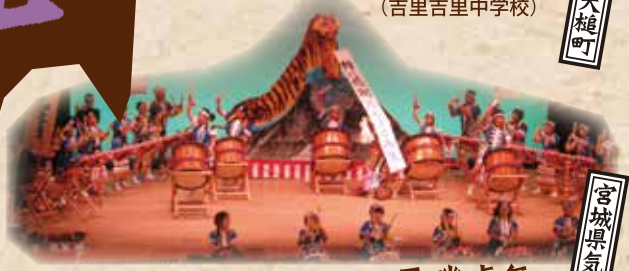
平磯虎舞 (平磯芸能保存会)