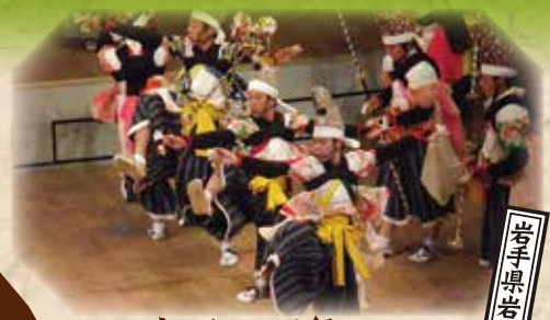
中野七頭舞 (小本中学校)