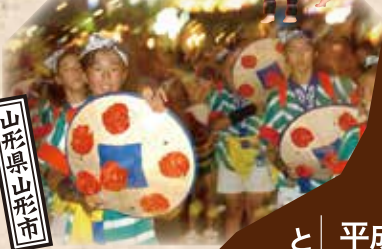
花笠踊り (ちびっこ四方山会)