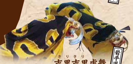
吉里吉里虎舞 (吉里吉里中学校)