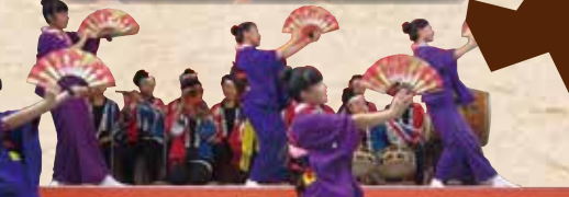
飾山囃子 (角館高校飾山囃子部)