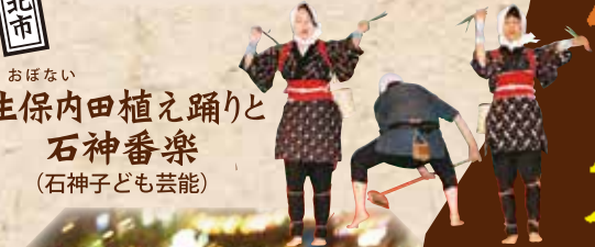
生保内田植え踊りと石神番楽 (石神子ども芸能)