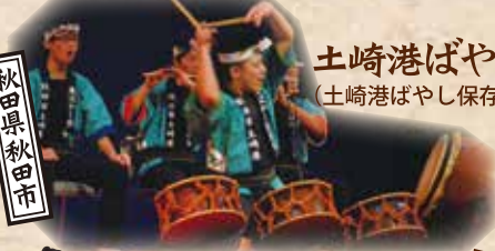
土崎港ばやし (土崎港ばやし保存会)