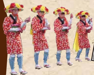
請戸の田植踊り (請戸芸能保存会)