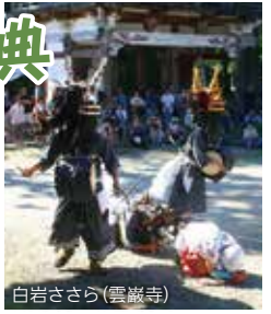
白岩ささら(雲巖寺)

東北の青少年及び東日本大震災被災地の民俗芸能団体を迎え、芸能披露を行います。また、飾山囃子やささら等の野外大競演会を開催し、全国に仙北芸能の魅力発信します。