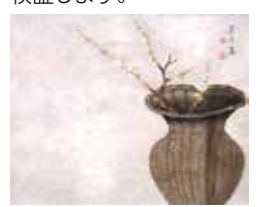
籠に梅図(佐竹義房)

江戸時代中期に花開いた秋田の美術文化。秋田蘭画や佐竹北家にまつわる展覧会や絵画研究者による講演・シンポジウムを開催し、秋田蘭画が江戸絵画史の中で果たした役割や成果を検証します。