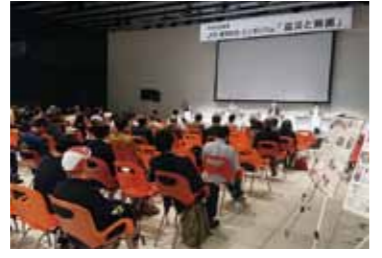
シンポジウムを熱心に聞き入るFC担当者。 かくのだてフィルムコミッション(仙北市観光課内) ☎43-3352 http://kakunodate-fc.jp/

かくのだてFCが支援した旅番組「いい旅・夢気分4Kスペシャル」が12月2日(日)18時から、BSテレビ東京系(全国放送)で放送されます。角館、田沢湖や乳頭温泉郷の魅力が4Kカメラの撮影により、今まで以上に色鮮やかに、大迫力で表現されていますので、ぜひともお楽しみにしてください。