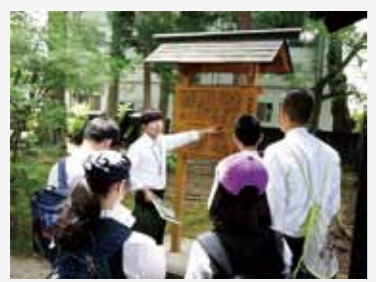
職場体験で説明する新人F.C.担当。