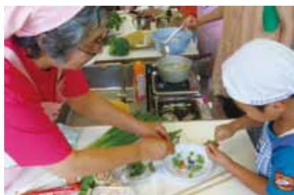
昨年のクッキング教室の様子。