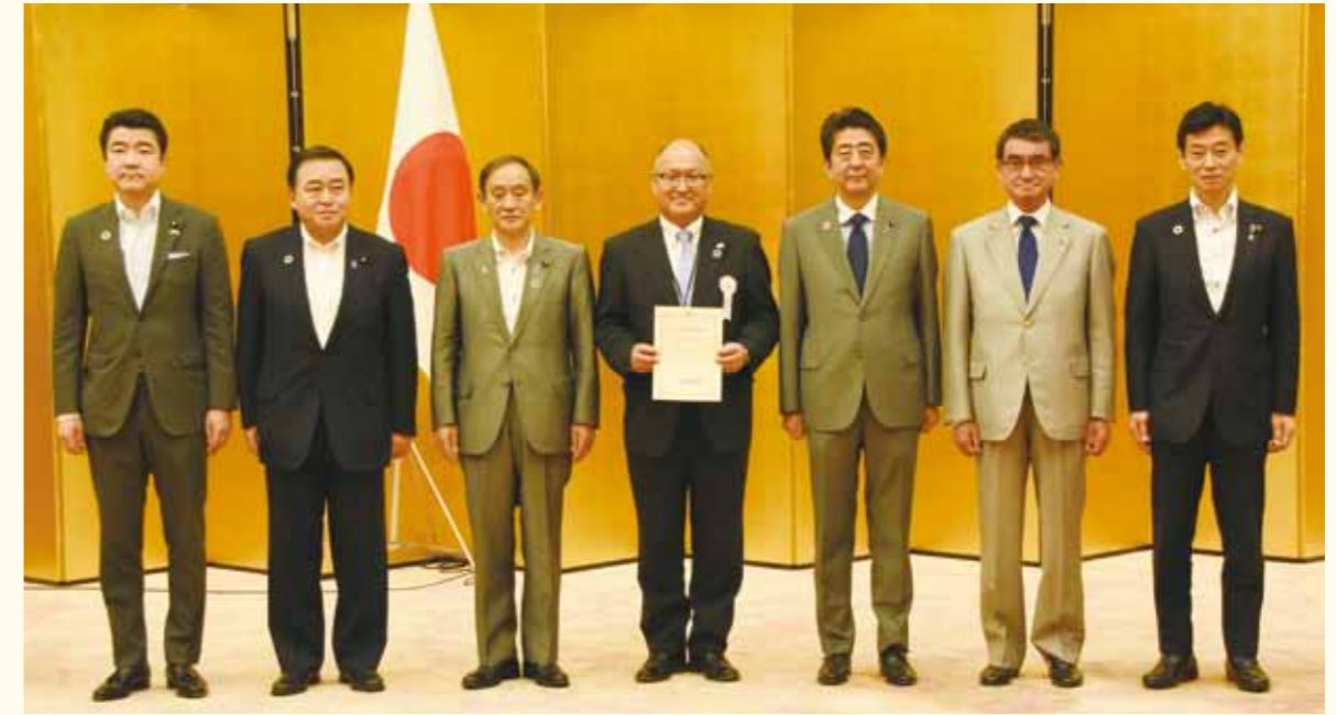
「SDGs 未来都市」選定証の授与式に出席する門脇市長（中央）。