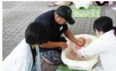
パパ、本番も頑張ってるね！2人で協力してスムーズにできるようにしたいね！