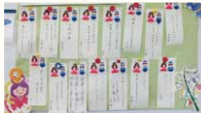
7月は七夕。最後に、短冊にお願いを書いてもらいました。みんな、安産で元気な赤ちゃんが産まれてくるように願っていました。