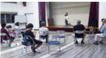
基礎から一緒に学んでみませんか。

「仙北市花マップ」の作成について 花のあるまちづくりの一環として、例年開催していた「仙北市花のある街づくりコンクール」に代わり、今年度から家庭で花づくりを楽しむ個人や花壇づくりを行っている町内会やまちづくり団体、企業、地域のボランティアを紹介する「仙北市花マップ」の作成に取り組みすることになりました。生涯学習課では「花マップ」への掲載にご協力いただける市内の個人・団体等を広く募集していますので、ご近所・お知り合い等で素敵な花づくりをされている方が居ましたらぜひご紹介ください。