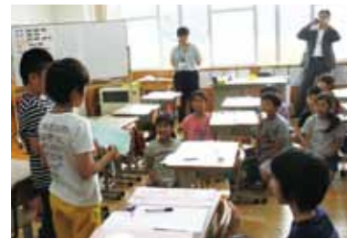
よりよい睡眠のためにできることをみんなで考え、発表しました。

子どもたちは真剣な表情で聞き入り、その後「よりよい睡眠のためにできること」を考えました。「宿題を早めにやる」「早い時間に寝る」などの他に、「8時以降は電子メディアを使わない」「電子メディアを使う時間を決める」など、電子メディアの使い方に関わる考えも多く出されました。睡眠に対する電子メディアの影響についてしっかりと学びました。