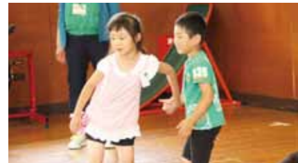
兄弟姉妹毎に集まる際に、お姉さんは弟の手をつなぎ離れないようにしていました。

体育館では学年毎に整列した後、兄弟姉妹で1番上の兄や姉のもとに集まりました。整然と移動が行われ、これまでの訓練が生かされていました。その後、保護者と生徒が一緒に帰るまでの動きや引き渡す際の手順を、保護者の方と生徒に実演していただき、確認しました。