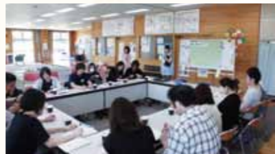
最後に参加者の交流会です。数年後は、同じ学校のPTAかもね！赤ちゃんの誕生待ってるね！