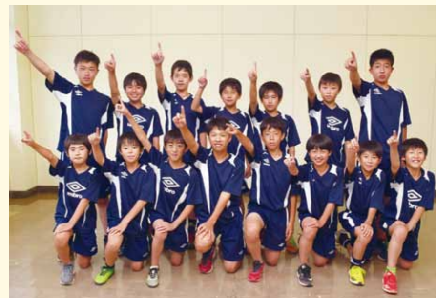
FC角館セレジエスタは、7月15日・16日に山形県天童市で開催される東北大会に秋田県代表として出場します。

6月9日・10日、TDK秋田総合スポーツセンター（にかほ市）で開催された「第41回秋田県スポーツ少年団競技別（サッカー）交流大会兼第8回ブラウブリッツ秋田杯少年サッカー大会」でFC角館セレジエスタが準優勝し、東北大会への切符をつかみました。 県内の各地域代表32チームによるトーナメント戦で行われた今大会