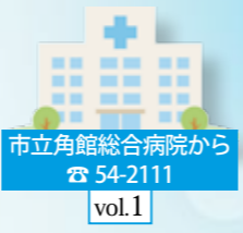
市立角館総合病院から ☎ 54-2111 vol.1

だとすれば、なおさら地方と大都市の間で、過疎と過密を是正する「国策」が必要で、あわせて地方の強み、特色ある文化や安心なコミュニケーション、農地や森林、水といった財産を維持継承する取り組みが欠かせません。