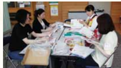
管理栄養士が、妊娠中の栄養についてお話しながら意見交換を行いました。妊娠中の赤ちゃんが吸収する栄養は、ママの食事と直結！