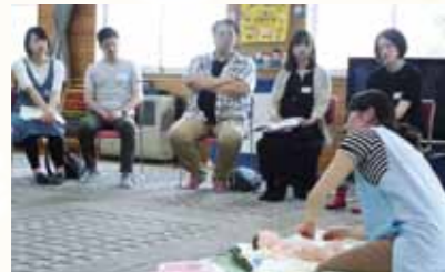
保健師が、参加者に沐浴実技をデモンストレーションしてから沐浴体験です。