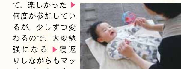
ママの声かけに楽しそうな笑顔。

▶あっという間で楽しく過ごすことができた ▶歌を歌いながらマッサージはとても楽しかった。また参加したいと思う ▶普段お兄ちゃんがいて、赤ちゃんとゆっくり向き合うことが難しいのでとてもよい機会になった ▶オイルを使ったりしてリラックスできて、楽しかった ▶