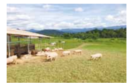
ブナ森牧場を活用した豚の放牧