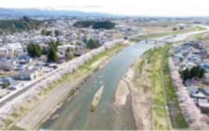
ドローンから見える松木内川堤ソメイヨシノ

株式会社くまがい印刷(秋田市)のご協力により、桜まつり期間中に1日限定で、ドローンのカメラからの映像をGoogle型ディスプレイに映して、空からの景色をバーチャルリアリティーで体験する実証実験を実施。