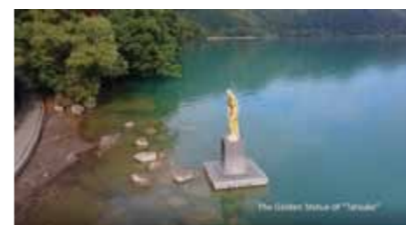
【仙北賞】『The Golden Statue of "Tatsuko" Onsen Tour』たつこ姫ファンクラブ(仙北市)