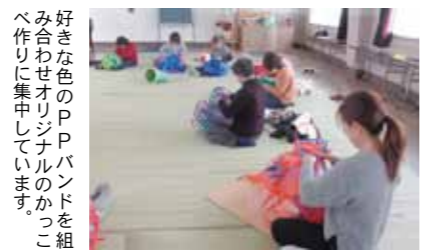
好きな色のPPバンドを組み合わせたオリジナルのかっこ作り集中しています。

近年にない豪雪により春の訪れが一層待ち遠しい今年の3月、西木公民館では、山菜採りや畑仕事に役立つ「かっこ作り」の教室が開催されました。 募集の受付開始後、瞬く間に定員となるほどの人気で、多くの方が受講できるよう急遽開催回数を増やして行われました。 参加された皆さんは、春には自分で作ったかっこを腰に下げて畑や山菜採りに出かける姿を思い浮かべながら黙々とかっこ作り作業に集中していました。