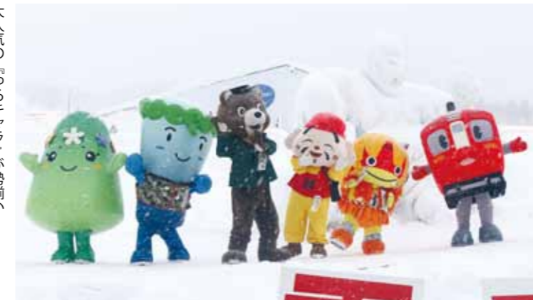
大人気の『ゆるキャラ』が勢揃い！

今年初開催の『汁一椀グランプリ』では、8出店者からこだわりの1杯が提供され、来場者は体を温めながらお気に入りの1杯に投票し、屋台村田舎料理なかや(秋田市)の「日本海秋田ずわい蟹汁鍋」が、初代グランプリに輝きました。