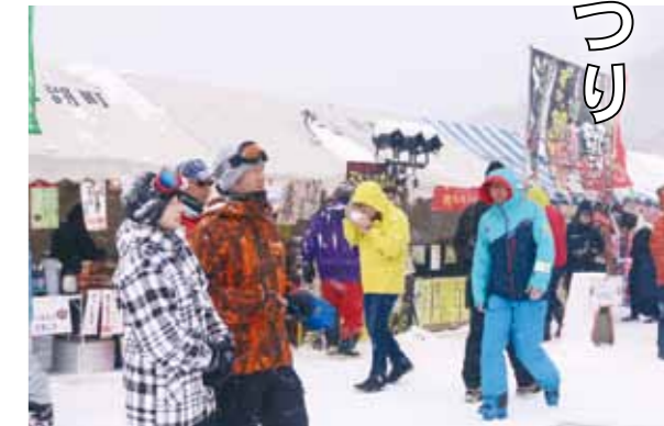
会場には、たくさんの屋台が軒を連ね、美味しい香りが漂いました。

2月17日・18日の2日間、たざわ湖スキー場特設会場で「第47回田沢湖高原雪まつり」が開催されました。