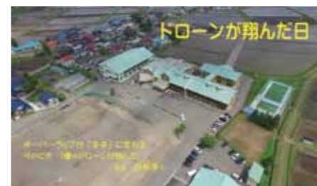
【市長賞】『ドローンが翔んだ日』西明寺小学校(仙北市)