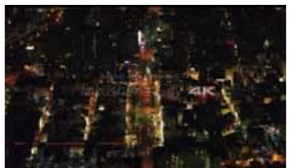
【優秀賞(チーム長尺部門)】『そらたび -Tokushima City- #007&#009 Spin Off Trailer -』そらぐみ(徳島県)