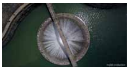
【特別賞】『Shing Mun Bell-Mouth Spillway』Ray Leung(中国)