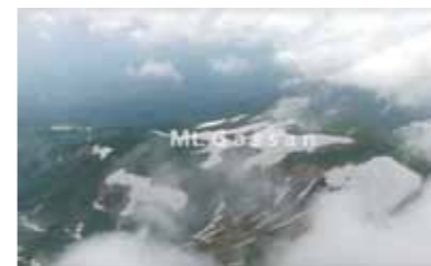
【優秀賞(チーム短尺部門)】『春の月山を取り囲む市町村の雪上桜』仙台CATV 編成制作部(宮城県)