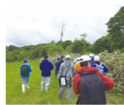
国有林野の現地調査