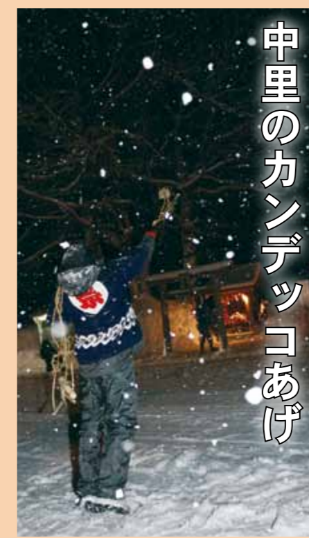
中里のカンデッコあげ

なお、お預かりした「しめ飾り」「門松」などは、後日、お祓いのうえお焚きあげします。