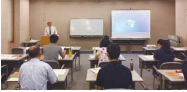
国家戦略特区旅行業務取扱管理者研修

【活用状況】 8月 国家戦略特区旅行業務取扱管理者研修(観光庁主催)受講者12人(うち12人修了試験合格) 9月 国内旅行業務取扱管理者試験(試験内容を一部免除)受験者12人 10月 国内旅行業務取扱管理者試験合格者10人(平成30年) 11月 仙北市農山村体験推進協議会が地域限定旅行業の新規登録