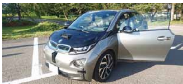
実験車両(電気自動車BMW i3)

9月〜11月にかけて、AZAPA株式会社(愛知県)と株式会社リコー(東京都)が、自動運転の実証実験を実施。実証実験は、緊急時にドライバーの運転に代わる自動運転「レベル3」にあたるもので、わらび座の敷地内や周辺の公道で走行を行った。実験期間における走行日数は57日間で、そのうち公道での走行は9日間だった。