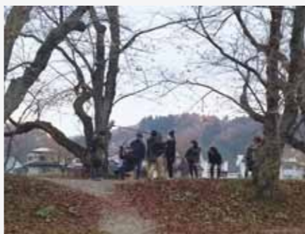
角館の松木内川堤での撮影風景。

わらび劇場の撮影には、約20人のエキストラの方々に観客役で出演していただきました。これまでも度々エキストラで協力いただいている女性は、監督から笑顔や驚いた表情などの指示があり、「役者気分が楽しかった」と話していました。一緒に参加した友人からも「また声をかけてね」と言われたそう