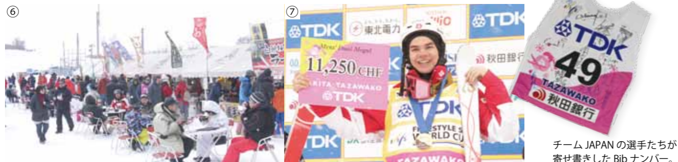
チーム JAPAN の選手たちが寄せ書きした Bib ナンバー。