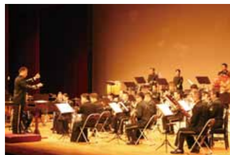
バラエティに富んだ楽曲で聴衆を魅了した大湊音楽隊の演奏。

10月16日、仙北市民会館で「海上自衛隊大湊音楽隊コンサート」が開催されました。 今年で発足60周年を迎えた大湊音楽隊。この日はクラシック音楽から秋田のご当地ヒーロー・超神ネイガールのテーマソングまで、多彩な楽曲を時にはしっかりと、時にはコミカルに演奏し聴衆を楽しませました。 さらにアンコールで、おなじみの軍艦進行曲が演奏される