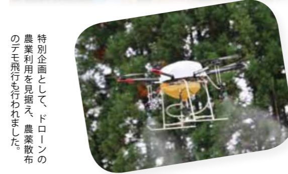
特別企画として、ドローンの農業利用を見据え、農業散布のデモ飛行も行われました。

農・商・工が手をつないで 10月22日・23日の両日、神代市民体育館を主会場に第12回仙北市産業祭が開催されました。 今年は両日とも天候に恵まれ、たくさんの方の来場者で会場は大いに賑わいました。 今年度の農林産物品評会には、野菜・果実などを中心に296点の出品がありました。審査では、昨年比出品数は減少したものの、病害虫の発生が少なかったことにより、品種特性の表れた良品が揃っているとの講評をいただきました。