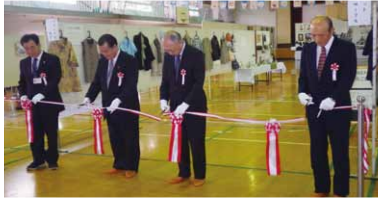
テープカットで開会をお祝いました。

【角館地区】 10月15日・16日（角館交流センター） 文化祭は角館中学校吹奏楽部による演奏で賑やかに幕開けしました。会場内では数多くの作品展示や呈茶でもてなし、商工会婦人部による食堂も開設されました。2日目は角館芸術文化協会会員による芸能発表も行われ、民謡や踊りなどが披露されました。