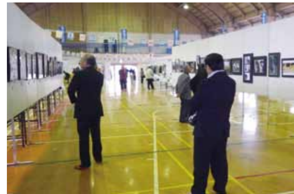
会場には午前中から多くの来場者が続々と。