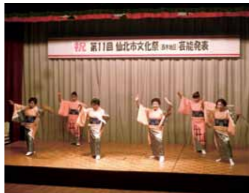
ステージでは華やかな芸能発表。

【田沢湖地区】 10月29日・30日（生保内市民体育館） 会場には、田沢湖芸術文化協会会員や田沢湖公民館を通じて活動する市民