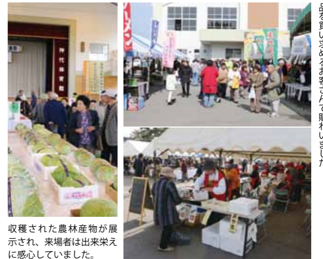
収穫された農林産物が展示され、来場者は出来栄に感心していました。