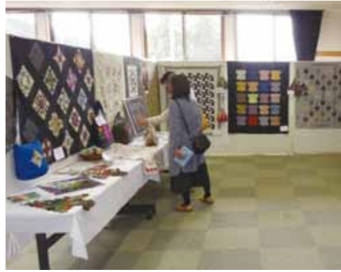
多彩な作品の数々を鑑賞する来場者。