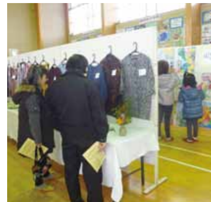
子どもから大人まで賑わいを見せました。