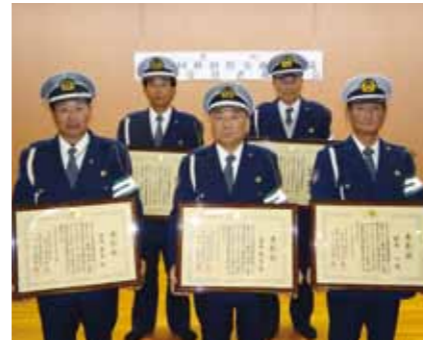
優良隊員として表彰された皆さん。