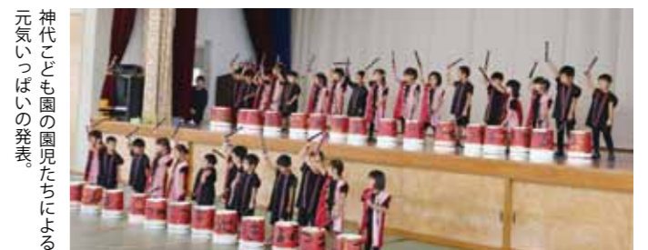
神代こども園の園児たちによる元気いっぱい発表。

駐車場には、商工会などたくさんのお店が並び、お目当ての商品を買い求めるお客さんで賑わいました。