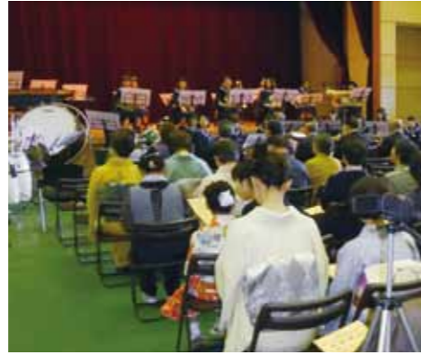
角館中学校吹奏楽部の演奏で幕開け。

【角館地区】 10月15日・16日（角館交流センター） 文化祭は角館中学校吹奏楽部による演奏で賑やかに幕開けしました。会場内では数多くの作品展示や呈茶でもてなし、商工会婦人部による食堂も開設されました。2日目は角館芸術文化協会会員による芸能発表も行われ、民謡や踊りなどが披露されました。