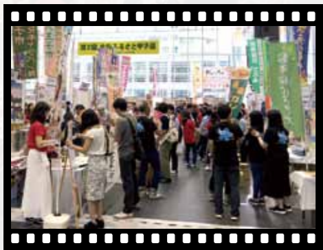
たくさんの人で賑わう、全国ふるさと甲子園会場

各団体が個性豊かなPRを行う中、かくのだてフィルムコミッションは「御狩場焼き」をPRしました。