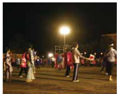
たくさんの参加者が集まり、大きな輪になって盆踊りを楽しみました。

土芸能や多彩なアトラクションが行われ、出店コーナーも立ち並び、会場は賑やかな雰囲気になりました。