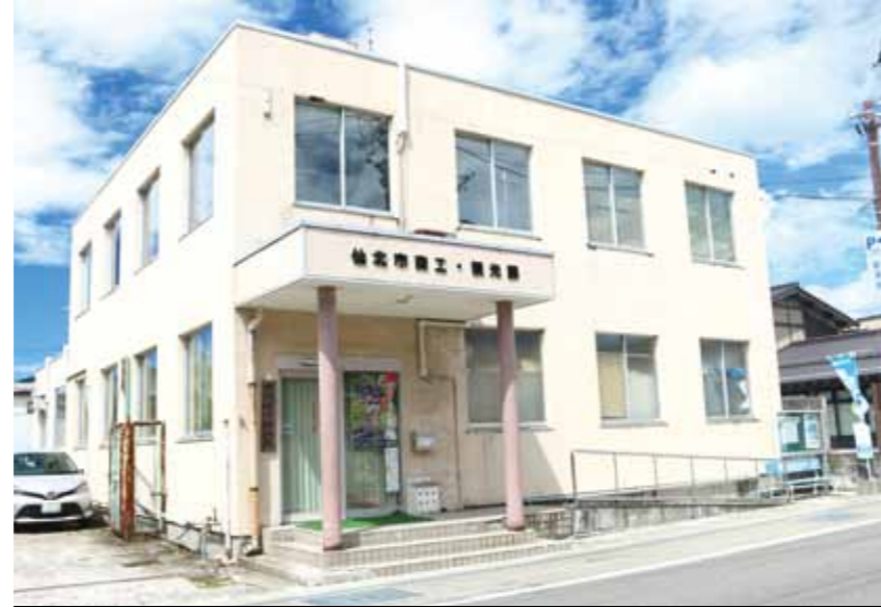
(左上から時計回りに) 田沢湖庁舎、角館庁舎、西木庁舎、中町庁舎

正議案を市議会に認めていただく必要があります。その議決は出席議員の3分の2以上の賛成が必要な「特別議決」です。これまでどおり議会・市民の皆さまには丁寧な説明を尽くしますが、合併特例債という有利な財源を活用するためには、平成32年3月までに新庁舎の建設を終え、平成33年3月までに田沢湖庁舎の耐震工事等を完成しなければなりません。「まだ4年も先のこと。別の場所を考えられないか」との声も聞きます。しかし建設までに必要な市民とのコンセンサスづくり、市有地以外では地権者との用地交渉、各種法律に基づく許認可手続きの事務期限などを考えると、全く無理です。市が示した「角館病院跡地案」(基本構想)でさえ、今年度当初予算に関係費用(病院の解体に関する基礎調査や設計費用)を計上することが前提でした。しかし、市議会特別委員会に同案件が付託されており、審議途中での予算計上はできなかつたため、平成33年3月までに病院跡地を活用して統合庁舎を建築することは不可能になりました。つまり、今年7月市議会臨時会で用地取得費が可決された角館駅前以外に、新たな場所を検討する時間的猶予はないということです。