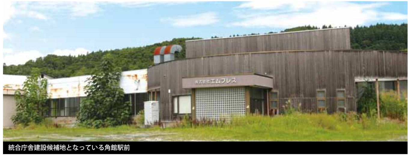
統合庁舎建設候補地となっている角館駅前