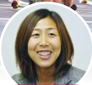
ゲストランナー 土佐礼子さん

今年の田沢湖マラソンは、9月18日(日)に開催されます。市民の皆さまも健康づくりのため、ぜひご参加ください。当日はコース周辺で交通規制が行われますので、ご協力をお願いします。詳しくは、仙北市ホームページのイベント欄をご覧ください。