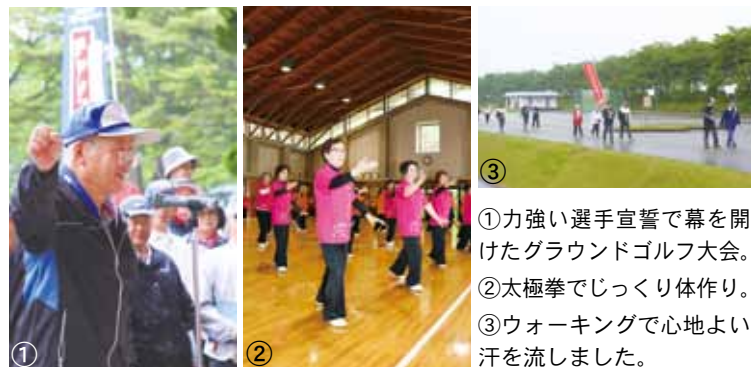
① 力強い選手宣誓で幕を開けたグラウンドゴルフ大会。 ② 太極拳でじっくり体作り。 ③ ウォーキングで心地よい汗を流しました。