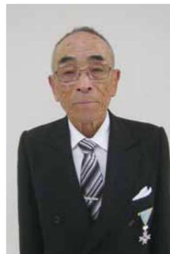
瑞宝単光章【消防功労】