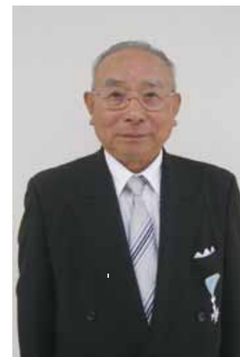
瑞宝単光章【消防功労】