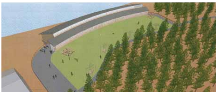
▶総事業費 3億8,578万5千円 ▶主な財源 3億7,810万円(国・県交付金、過疎債)

平成28年5月から「田沢湖クニマス未来館(仮称)」建設地の造成工事が始まります。平成29年4月の施設オープンに向け、6月末には本体工事が発注される予定となっています。