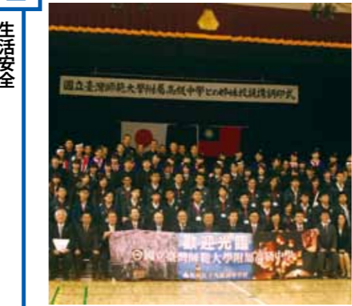
児童徒との交流を支援します。

仙北市に住所を有する重度身体障がい者（児）、知的障がい者（児）、精神障がい者（児）、難病患者（特定医療費（指定難病））の生活圏の拡大を図