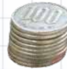
会計別予算総括表

平成 28 年度当初予算の概要 平成 28 年度当初予算については、国の「経済・財政再生計画」に基づく経済再生に寄与する歳出改革、歳入改革を実施する方針を受け、政策経費の抑制や公債負担の計画的な縮減、自主財源の確保に努める一方で「仙北市総合戦略」と「第 2 次仙北市総合計画」に掲げる目標達成に向けた編成としています。直面する人口減少対策として新たに第 2 子以降の保育料無料化に取り組みほか、定住・移住対策については新婚世帯への家賃助成を継続し、新たに市外から移住する子育て世帯等への助成も計上しています。また、クニマス未来館の建設や田町荒屋敷線(内川橋)整備事業等による普通建設事業費の増などを受け、一般会計では、前年度比 5 億 8500 万円の増となる 190 億円の予算規模となっています。 併せて、国の補正予算に対応し関連事業を先行して実施するための予算を平成 27 年度補正予算として計上し、当初予算と合わせて展開していきます。