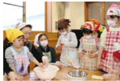
仙北市産の越冬野菜をたっぷりひき肉に混ぜてハンバーグを作る園児たち。このあとじっくり焼いて雪下キャベツとパンにはさんで祖父母と一緒に美味しく食べました。

2月19日、ひのきない保育園で仙北市産の大根、人参、キャベツなど越冬野菜を使ったハンバーガー作りが行われました。これは同園の祖父母参観日に合わせ、角館調理師会の皆さんの協力をいただき、初めて行われたものです。園児たち48人は手洗い指導を受けたあと、早速ハンバーガー作りに挑戦。参観に訪れた祖父母と一緒にハンバーガーのタネをこねながら楽し