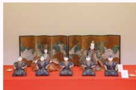
数多くの雛人形が展示されている角館榊細工伝承館の「ひな人形展」は、4月10日（日）までの会期となります。仙北市民は入館無料ですので、期間中にぜひ、お立ち寄りください。

角館榊細工伝承館では開館以来、この時期、「ひな人形展」を開催しています。佐竹北家などの旧家には、古雛と