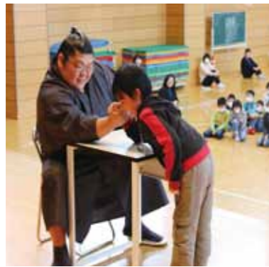
豪風関との腕相撲は大盛り上がりで、次々と児童たちが挑戦。しかし、びくともしない豪風関の力強さにびっくりしていました。

体育館に集まった全校児童は、なかなか見ることができない本物の力士を見て大喜び。豪風関のプロフィールを紹介した後、腕相撲したり、思い出に残る一番などを質問したり、児童