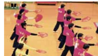
2017年に秋田で開催される「ねんりんピック」にも会員が参加します。

4月からの新入会員を募集(3月20日締切)しています。興味のある方は一度、見学に来てみてください。