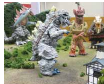
各地の当地怪獣が集めた全国サミット。仙北市の温泉怪獣タマグラ(中央手前)がどんな活躍をみせるか、期待が高まります。

昨年7月、仙北市は第一通信社とのタイアップ事業で、玉川温泉をモチーフとした温泉怪獣「タマグラ」