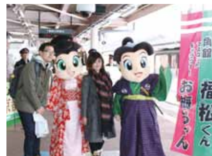
JR角館駅では、出迎えたお梅ちゃん、福松くんと一緒に利用客が記念撮影する姿が見られました。

JR田沢湖駅では、龍神太鼓が利用客を賑やかに出迎え、駅構内ではお酒や山の芋鍋などが振る舞われました。JR角館駅では、ゆるキャラ「お梅ちゃん、福松くん」が出迎え、駅前蔵では観光案内のほか、お酒や漬物、内陸線のタイアップ企画でバター餅が振る舞われ、温かい