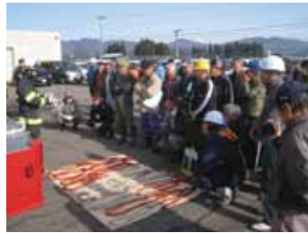
大曲広域消防本部角館消防署の救助隊員による簡単で解けにくい命綱の講習はとてためになり、参加者は真剣な面持ちで聞いていました。

件発生しています。このうち55件は屋根の雪下ろしなどによる高所からの転落となっているため、くれぐれも雪下ろしの際は、慎重な作業を心掛けてください。