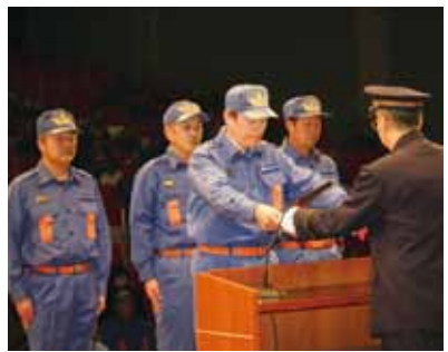
日頃のご尽力に対し、各章の表彰が行われました。