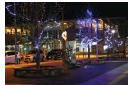
幻想的なイルミネーションは3月まで点灯しています。田沢湖駅近くまでいらした際は、ぜひ立ち寄りください。