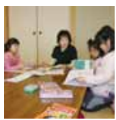
「学び教室」は毎回参加する子どもたちに大人気です。