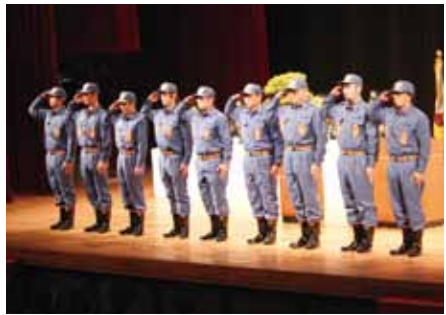
新入団員の紹介では、全員が登壇して敬礼しました。