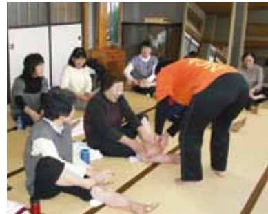
手軽にできる運動で、参加者は和気あいあいと健康づくりに励んでいました。

防や肩こり解消の体操、ジワジワ血流をアップする全身運動など、参加者は和やかな雰囲気の中で、運動に取り組んでいました。