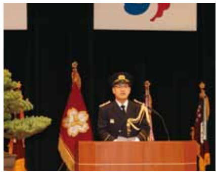
式辞を述べる門脇光浩市長。