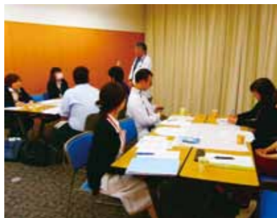
「介護が必要になっても安心して暮らせるためには何が必要か？」参加者は真剣に考えました。

介護が必要となっても安心して生活するにはどのような支援が必要か、今ある資源をどう活かすかなど、多職種で話し合いをしています。医療と介護の垣根のない関係づくりが、地域の皆さまの安心に繋がると考えています。