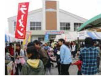
屋外会場では、青空市場や食堂などが出店。大勢の見物客で賑わいました。