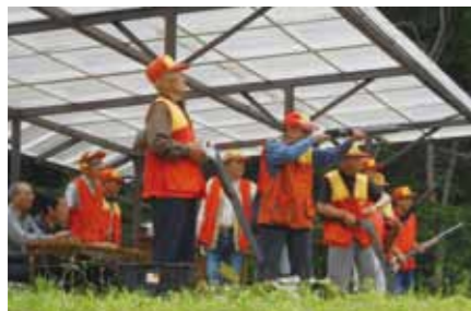
標的に狙いを定め、息詰まる瞬間。