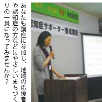
あなたも講座に参加し、地域の応援者や認知症の方などにやさしいまちづくりの一員になってみませんか？