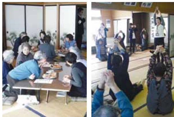
集まった皆さまは、体操指導を受けたり、お茶会をしたりしながら、和気あいあいと会話を楽しんでいました。

次回は、11月25日13時30分から、角館交流センターで「みんなのカフェ」を開催しますので、皆さまお気軽にご参加ください。